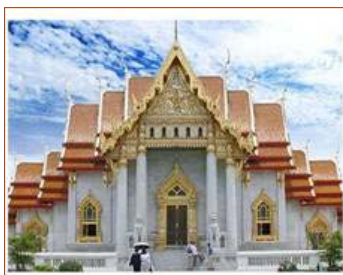
ตัวอย่างวัดของศาสนาพุทธ

พจนานุกรมพุทธศาสน์ ฉบับประมวลศัพท์ (2538: 291) ได้นิยามความหมายของ “ศาสนา” ว่าเป็น คำสอน, คำสั่งสอน, ปัจจุบันใช้หมายถึงลัทธิความเชื่อถืออย่างหนึ่งๆ พร้อมด้วยหลักคำสอน ลัทธิพิธี องค์กรและกิจการทั่วไปของหมู่ชนผู้นับถือลัทธิความเชื่ออย่างนั้นๆ ทั้งหมด รายละเอียดเกี่ยวกับศาสนาต่างๆ ในประเทศไทย ดูเพิ่มเติมใน ภาคผนวก ก สรุปลความหมายของ “ศาสนา” ว่าเป็นแบบแผนความเชื่อที่ตอบสนองความศรัทธาของสังคม