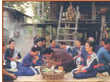
ชาวเรณูนคร จังหวัดนครพนมมีประเพณีการต้อนรับแขกผู้มาเยือนด้วยการเลี้ยงดู (น้ำมาชนิดหนึ่ง)