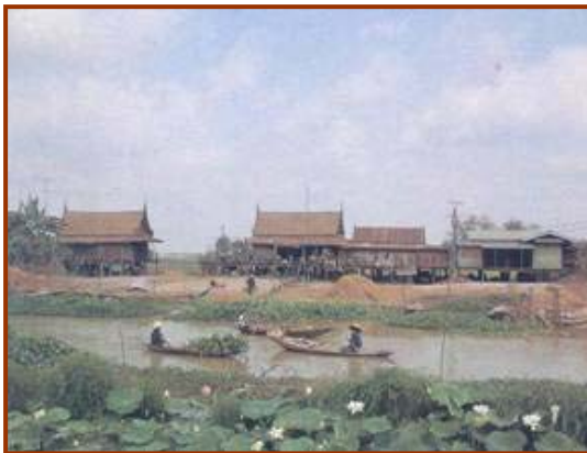
เกษตรกรรมเป็นวัฒนธรรมของชาวชนบทไทย

สรุป ความหมายของ “วัฒนธรรม” คือ แบบแผนการดำเนินชีวิตที่ถือปฏิบัติ ปรับเปลี่ยนสืบทอดกันมาทั้งที่เป็นรูปธรรม และนามธรรม