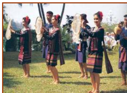
เซิ้งสวิงเป็นการแสดงพื้นบ้านของภาคอีสาน