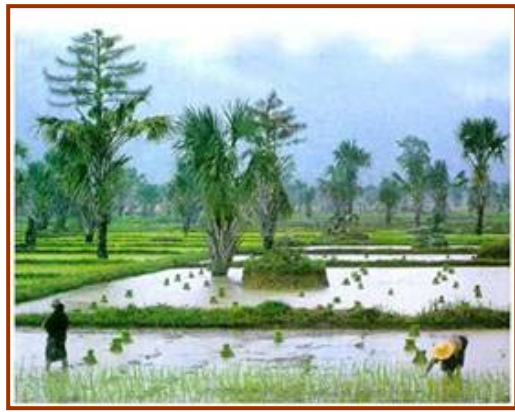
วิถีชีวิตของชาวไทยในภาคกลาง