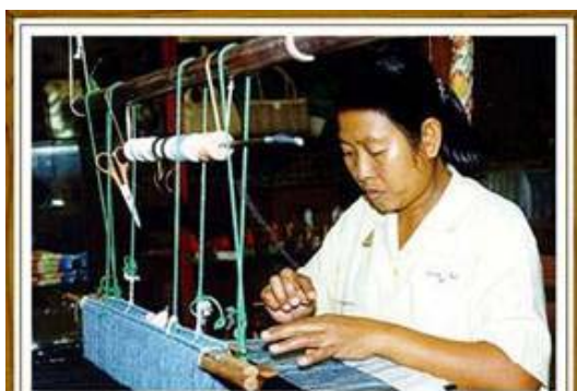
การทอผ้าจัดเป็นศิลปะพื้นบ้านหรือศิลปะท้องถิ่น

ประเภทที่ 3 คือ กีฬาหรือการละเล่นพื้นบ้าน เช่น การแข่งกลองเสี่ยง เป็นต้น