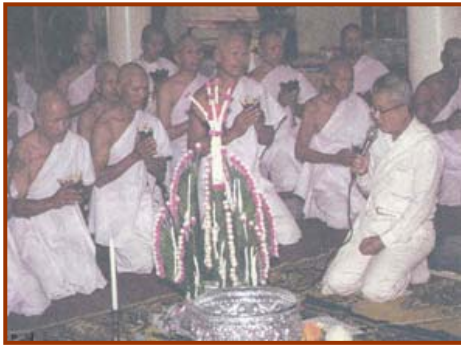
การทำวัณนาคเป็นจารีตประเพณีไทยที่เกี่ยวข้องกับพุทธศาสนา

สรุป ความหมายของ “จารีตประเพณี” คือ ข้อปฏิบัติและข้อห้ามในการควบคุมพฤติกรรมทั้งแง่บวก และแง่ลบ ให้เป็นไปตามความคาดหวังของสังคม